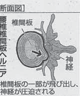
【断面図】 椎間板の一部が飛び出し、神経が圧迫される

背骨(脊柱)は24個の椎骨でできている。中には脊髄という中枢神経が通り、全身への神経が枝分かれしている。